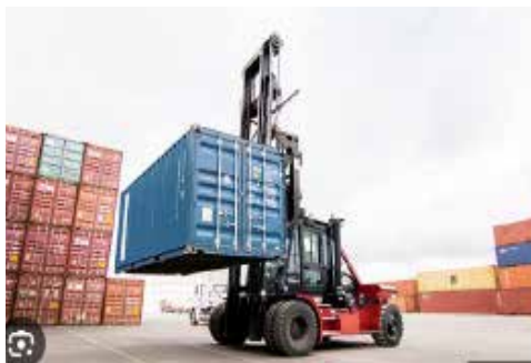
Контейнерный штабелер или манипулятор